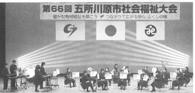
オープニングで美しいサウンドを披露した金木中学校吹奏楽部の皆さん