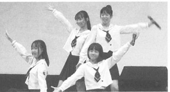
りんご娘の妹ユニットアルプスおとめに大きな拍手が。