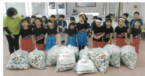
みどりの風こども園かなぎ さくら組のみなさん 金木支所へたくさんのエコキャップ、プルタブを届け、かっこいいお遊戯も披露してくれました