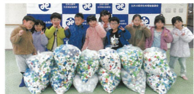
みんなで持ち寄り集めたプルタブを届けてくれたまつしま団地こども園の代表の園児たち