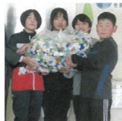
たくさんのエコキャップを届けてくれた、東峰小学校企画委員長の皆さん