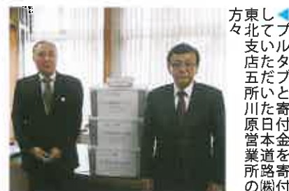
▲方東し北てプ支いル店たタ五だい五所い川た寄原日付管本金業道を所路寄の(関付