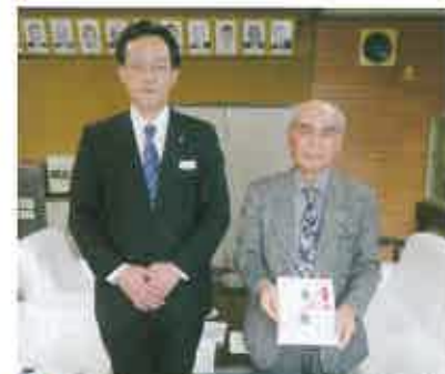
▲(株)ユニバースは、お客様募金と企業貢献で発電機を贈呈。五所川原支店長(左)が会長に目録を手渡しました。