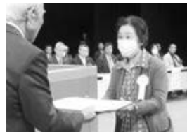
感謝状を受け取るうめだりんご園様