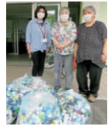
▲たくさんエコキャップ、フルタプを寄付くださった、ラ・プリペラのみなさん