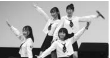
りんご娘の妹ユニットアルプスおとめに大きな拍手が。