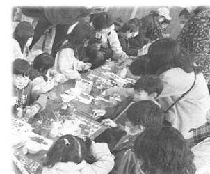
3周年イベントでクリスマスツリー作成