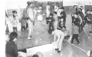
音楽に合わせて玉入れを楽しむ