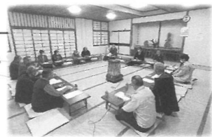
栄地区で市民が意見交換し、対策を探る