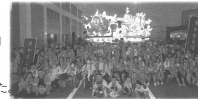
参加ねぶたの前で出陣を待つ