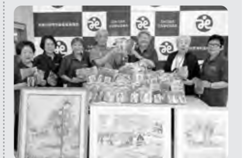
▲手作りポシエット、ちぎり絵を寄付くださった、五所川原地区婦人会、日赤五所川原分団のみなさん