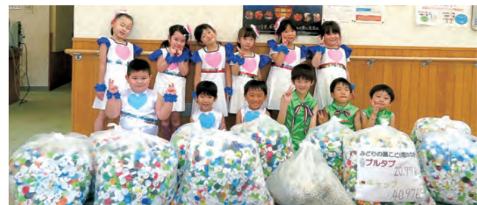
▲エコキャップ等を届けてくれた、こども園かなぎのもも組とさくら組のみなさん