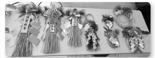
お好みのしめ飾りを選び、お手本にして参加者は作業を始める。