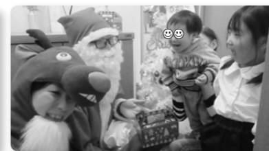
ボランティアがサンタクロースに扮して、訪問や記念写真に協力。