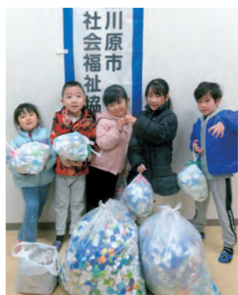
▲エコキャップを届けてくれたこども園もがわのひまわり組のみなさん