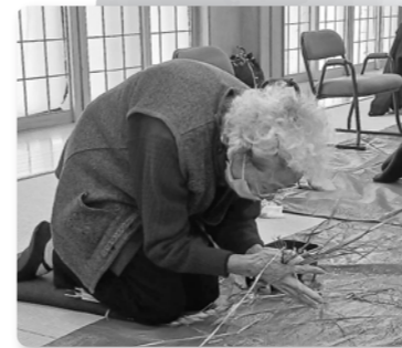
縄ないの技を取り戻し、「じょんずぐいってらど」と楽しみながら黙々と続ける参加者。